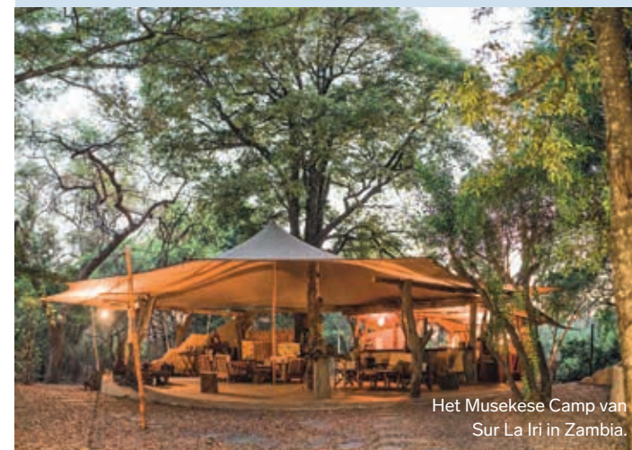
Het Musekese Camp van Sur La Iri in Zambia.

Klimaatbewust en respectvol reizen zit in de lift. Ook op deze locaties geef jij iets terug aan de natuur en/of de locals.