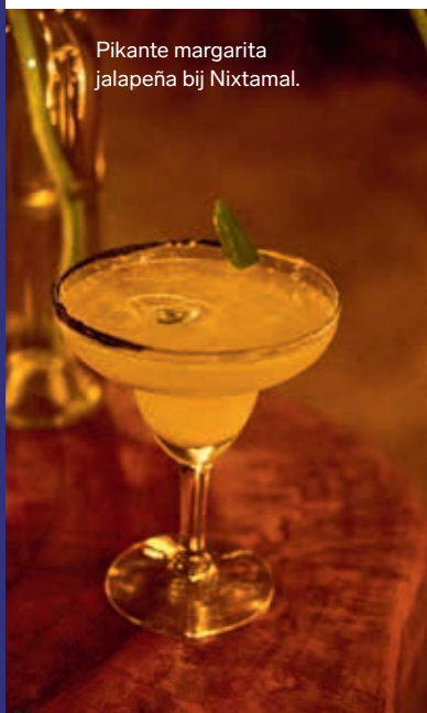
Pikante margarita jalapeña bij Nixtamal.