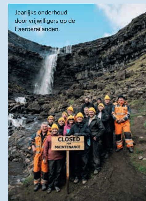
Jaarlijks onderhoud door vrijwilligers op de Faeröereilanden.

myjordanjourney.com/experience-meaningful-travel