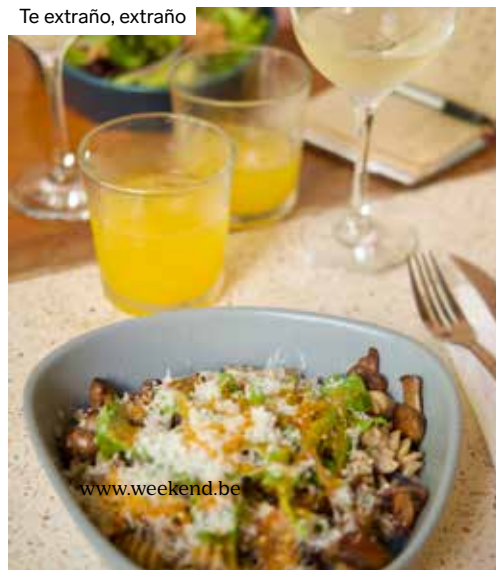
Te extraño, extraño