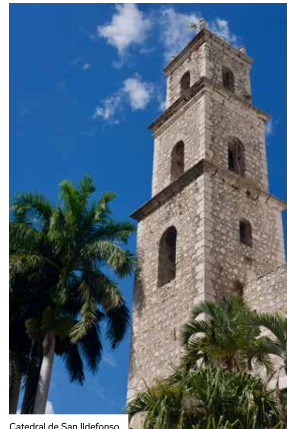
Catedral de San Ildefonso