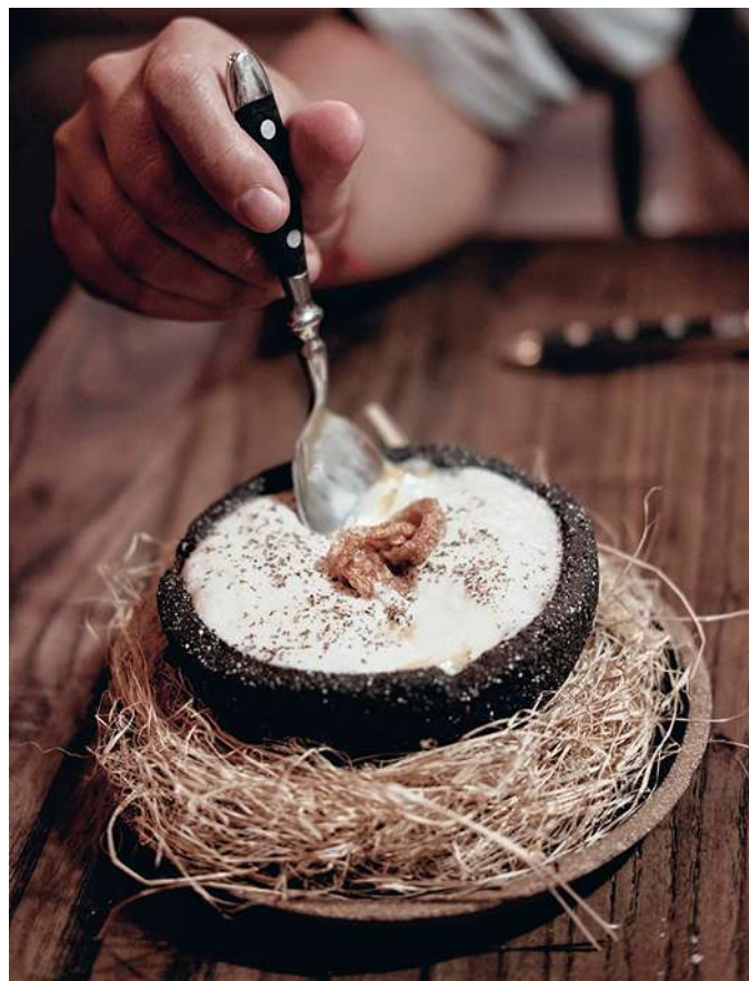
Huevo sorpresa in La Mundana.