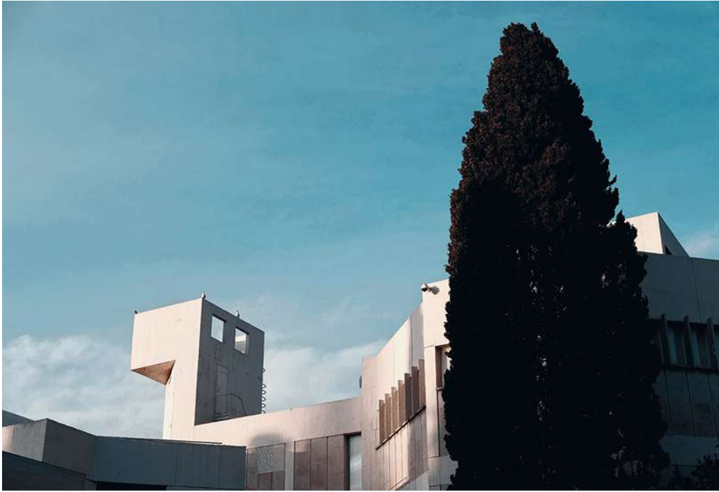
Boven: Fundació Joan Miró. Rechts: Après Ski in El Born. Onder: Jardí Botànic.